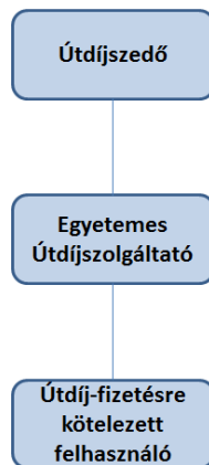
Figura 1 Raportul contractual dintre autoritatea de colectare a taxei rutiere, furnizorul de servicii universale de taxare rutieră și utilizatorul obligat la plata taxei rutiere

Raportul contractual dintre autoritatea de colectare a taxei rutiere, furnizorul de servicii universale de taxare rutieră și utilizatorul obligat la plata taxei rutiere este ilustrat de următorul grafic: